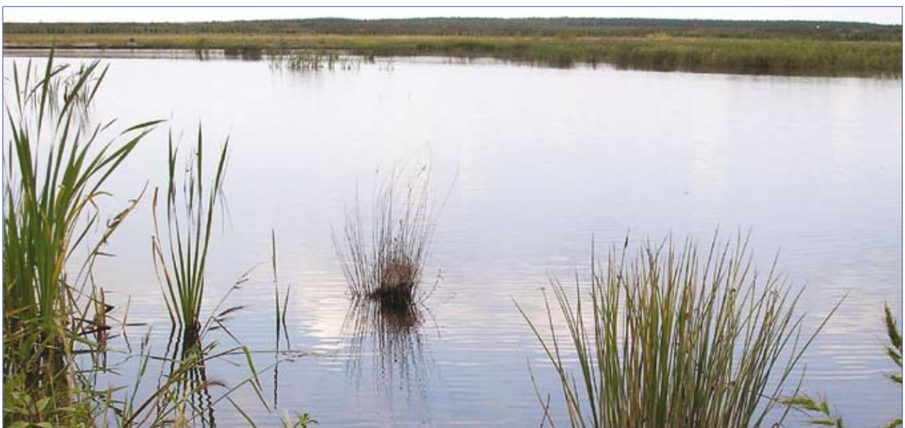
Bergener See 2007